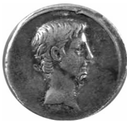
Denarius argenteus (cum imagine Augusti)

Intra primam dimidiam partem tertii sæculi Romani argenteos nummos cudere cœperunt, qui eiusdem ponderis erant ac nummi Græcarum civitatum Italiæ meridionalis. Exeunte eodem sæculo Romani novum systema monetarium creaverunt in « denario » argenteo nitens, cuius pondus fere idem erat ac pondus drachmæ Græcæ. « Denarius » vocatus est, quod tunc decem asses æquabat. In eodem systemate invenitur « quinquarius » (quinque asses) et « sestertius » (duo asses semis). « Sestertius » derivatus est a « semis tertio » i.e. ter dimidia pars. A nomine denarii post multa sæcula derivatum est vocabulum « dinar », quo nuncupatur nummus in orbe Arabum Mahumetanorum usitatus.