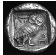
Tetradrachmum Atheniense (circa annum 450 a.C.n.)

Drachma (δραχμή), quo verbo antea significabatur « veruum pugnus », nomen factum est nummi sex obolorum. Ab eodem vocabulo, multis sæculis post, derivatum est verbum Arabicum « dirham », quod est nomen nummi in orbe Mahumetano maxime usitati.