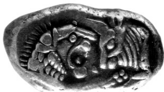
Argenteus nummus Lydiæ regis Cræsi

Nummus definiri potest ut pars signata et certi ponderis cuiusdam metalli. Cræsus, Lydiæ rex, sexto sæculo a.C.n. creavit primum nummum verum, i.e. signatum et certi ponderis sive auri, sive argenti ; vocabatur « stater », quod nomen Lydium Græci postea sibi assumpserunt (στατήρ). Hi nummi tunc præcipue adhibebantur ad stipendium militibus solvendum.