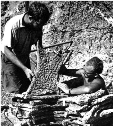
Regulares cupri massæ inventæ in Phœnicia nave circa annum 1200 a.C.n. demersa

Raro fit ut archæologi vestigia inveniant metallorum commercii. Tamen quædam Phœnicia navis, circa annum 1.200 a.C.n. ad litus Asiæ Minoris demersa, in fundo maris reperta est. Anno 1960 fieri potuit ut totum navis onus levaretur et in terra diligenter examinaretur. Ibi inter alia inventæ sunt regulares massæ cupri, quæ fusæ erant in formam pellis vaccinæ.