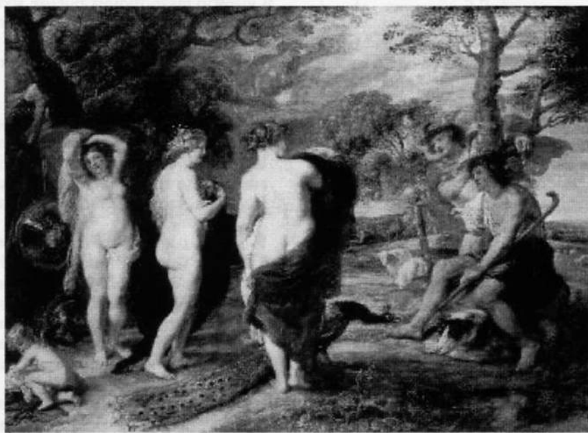
Petri Pauli Rubens Iudicium Paridis (c. 1635-38), Londinii in pinacotheca nationali.

Legimus igitur verum « certamen » ad reginam eligendam institutum esse, quod, omnibus rebus perspectis, a certaminibus reginellarum hodiernis non multum differt: puellae arcessuntur ex omnibus provinciis (etiannunc hodie unaquaeque provincia candidatam suam ad certamen mittit!), in domo regia congregantur (hodie in quodam amoeno palatio, unde spectaculum electionis televisifice transmittitur), « mundo muliebri » ceterisque ornamentis parantur (hodie societates, quae unguenta odores aliaque ornamenta fabricant venditant, ea puellis gratis offerunt ut nomen suum in praeconiis televisificis appareat!), puella electa coram populo diadema accipit (hodie item; de materia autem vide supra!). Duae sunt tamen differentiae: primum certamina hodie non iam diriguntur ab eunuchis, sed a societatibus televisificis quaestuosisque, quas nonnunquam nobilis domina repraesentat (exempli gratia in Francogallia et in Belgica domina Genovefa de Fontenay), deinde puellae non iam debent virgines